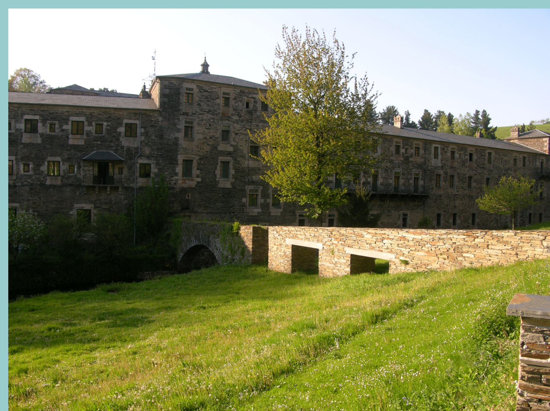
Mosteiro de Samos