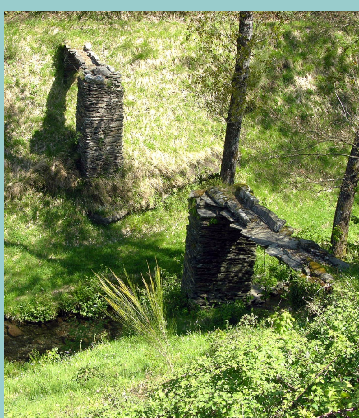
Airela (O Incio)

Os acueductos constrúense para conducir a auga salvando desniveis.